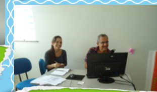
Utilização do ponto Telessaúde em Camacan

Acompanhe as novidades do TelessaúdeBA. Acesse: