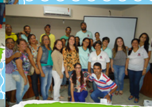
Treinamento em Pau Brasil