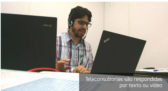
Teleconsultorias são respondidas por texto ou vídeo

No semestre, o NTC, em conjunto com as entidades parceiras, promoveu seis webpalestras , que envolveram assuntos relacionados a doenças como Ebola e Febre Chikungunya e Sífilis e temáticas referentes à Saúde Bucal, drogas ilícitas e parto humanizado e contaram com a presença de aproximadamente 900 participantes de municípios distintos baianos e até de outros estados brasileiros.