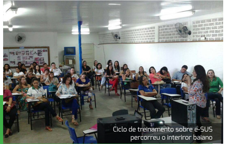
Ciclo de treinamento sobre e-SUS percorreu o interior baiano

Cerca de 1.700 agentes comunitários de saúde, enfermeiros, cirurgiões-dentistas, técnicos de enfermagem, auxiliares de saúde, dentre integrantes de outras categorias que compõem as equipes foram apoiados, remotamente, no decorrer de 52 encontros.